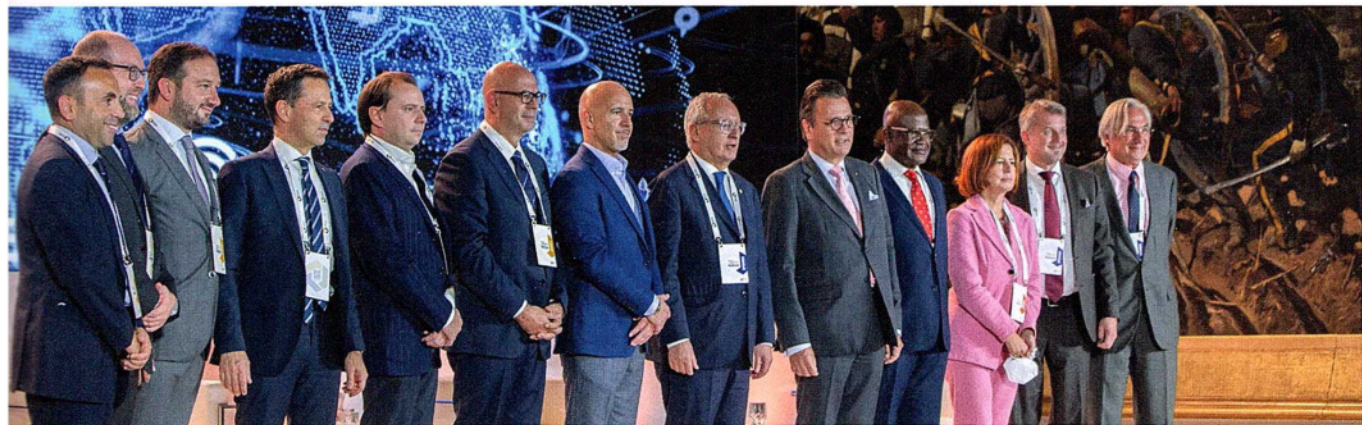
Die Teilnehmerinnen und Teilnehmer des Summits in Rom.